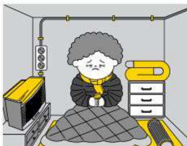
65세 이상 어르신