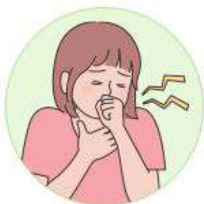
2주 이상 지속되는 기침