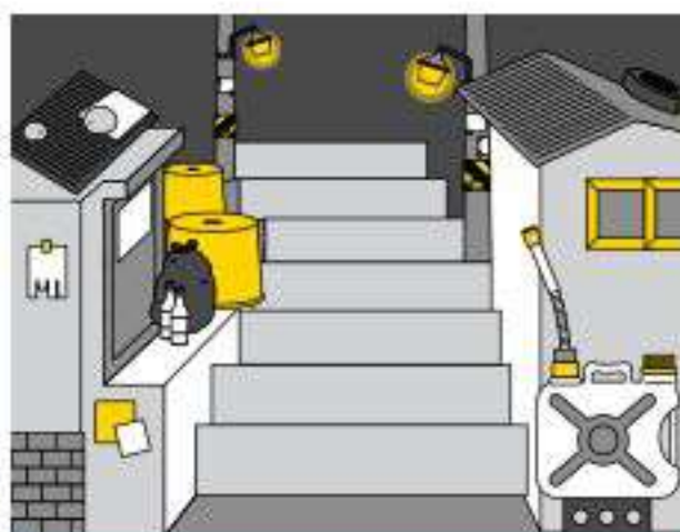
쪽방촌 및 고시텔 거주자